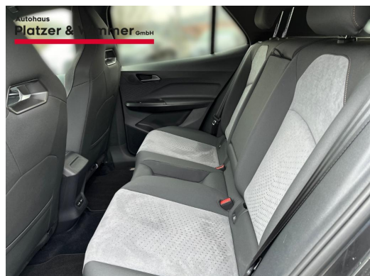
Autohaus Platzer & Wimmer GmbH