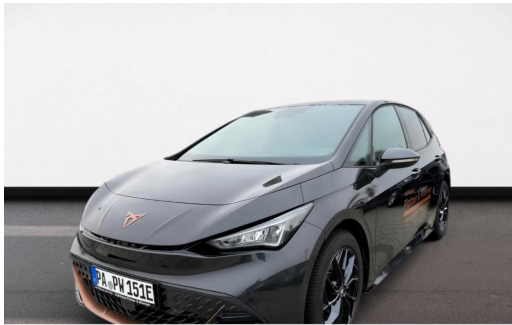
Autohaus Platzer & Wimmer GmbH Tel.: 08505 90 00 0