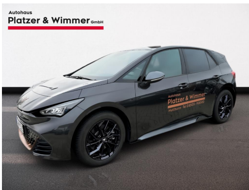
Autohaus Platzer & Wimmer GmbH

Ein Beispielsangebot der HYUNDAI Finance ein Geschäftsbereich der HYUNDAI Capital Bank Europe GmbH, Friedrich-Ebert-Anlage 35-37, 60327 Frankfurt am Main, für die wir als ungebundener Vermittler die für die Finanzierung notwendigen Unterlagen zusammenstellen. Bonität vorausgesetzt.