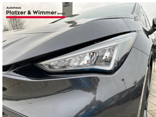
Autohaus Platzer & Wimmer GmbH