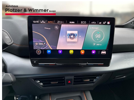
Autohaus Platzer & Wimmer GmbH