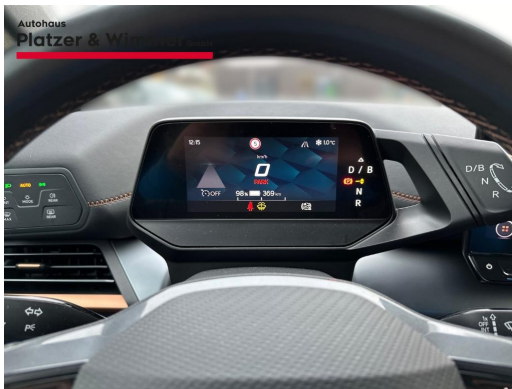
Autohaus Platzer & Wimmer GmbH