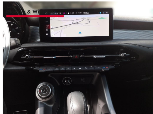
Autohaus Platzer & Wimmer GmbH