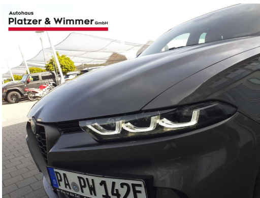
Autohaus Platzer & Wimmer GmbH