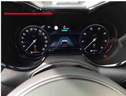
Autohaus Platzer & Wimmer GmbH