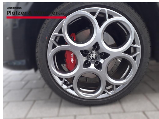
Autohaus Platzer & Wimmer GmbH