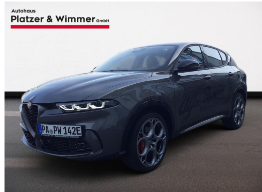
Autohaus Platzer & Wimmer GmbH