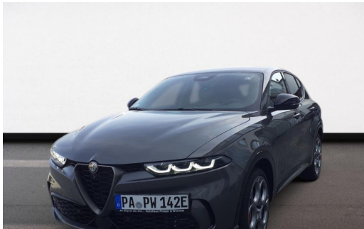
Autohaus Platzer & Wimmer GmbH Tel.: 08505 90 00 0